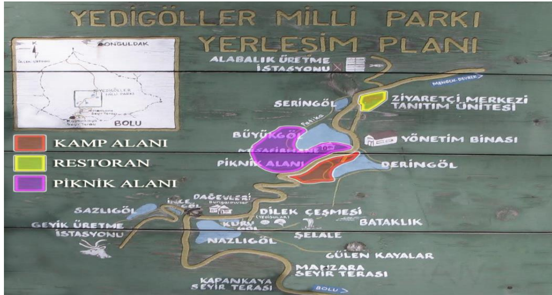
Şekil 1. Yedigöller Milli Parkı Yerleşim Planı

Yedigöller Milli Parkı'nın yerleşim planı aşağıdaki şekilde (Şekil 1) olduğu gibidir;