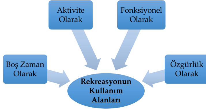
Şekil 2. Rekreasyonun Kullanım Alanları

2009). Rekreatif etkinlikler, bireyin yaşamındaki birçok sıkıntıdan kurtulmasını ve bireyin kendisini geliştirmesini sağlayarak, insanların serbest zamanlarında, eğlence ve tatmin dürtüleri ile, gönüllü olarak katıldıkları faaliyetlerdir.