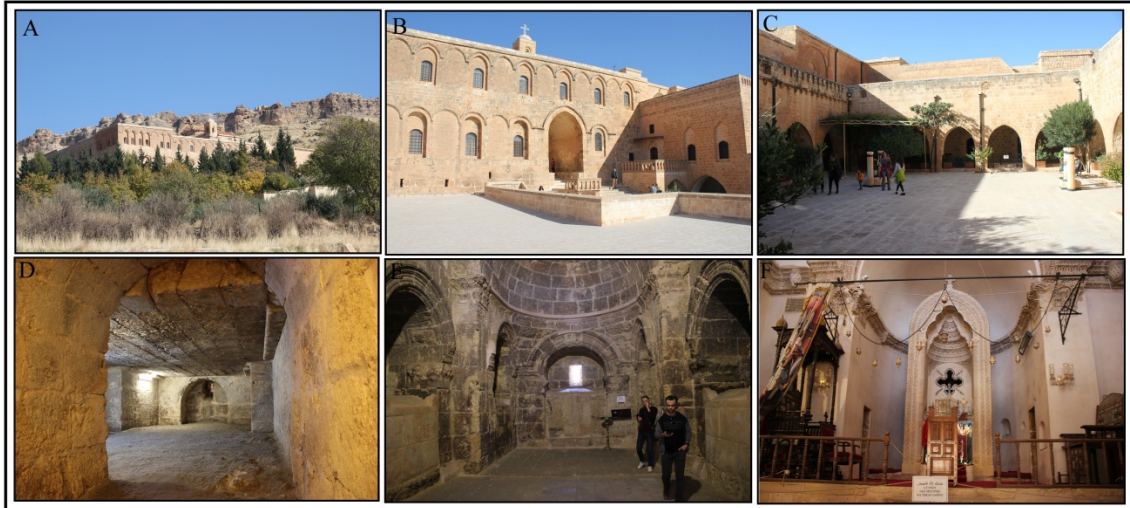
Fotoğraf 1. A: Manastırın Güneydoğu yönünden görünümü B: Dış avlu C: Eyvan D: Güneş Tapınağı E: Azizler Evi F: Meryem Ana Kilisesi

Erken dönem Hristiyanlığın mimari şaheserlerinden biri olan Deyrulzafaran Manastırı, Mardin kentinin 5 km doğusunda, Mardin Ovası'na hakim bir dağın orta yamacında kurulmuştur (Şekil 1). Manastırı oluşturan yapılar geçmiş yüzyıllardan kalmasına rağmen oldukça sağlamdırlar. Güney cephesi üç kattan oluşurken diğer cepheleri iki kattan meydana gelmektedir. Manastırın ilk yapısının büyük bir bölümü günümüze kadar olduğu gibi muhafaza edilmiştir. Aşağıdaki katta yer alan kiliselerin ve bazı odaların tavan ve duvarlarında o dönemden kalma kiremit ve büyük taşlar göze çarpmaktadır. Manastırın etrafını çevreleyen sur da manastır kadar eski olup yapı bloğunun önemli bir parçasını oluşturmaktadır (Fotoğraf 1 B, C). Deyrulzafaran'ın en önemli yapıları ise Mar Hananyo Kilisesi, Mar Petrus Kilisesi, Azizlerin Evi, Meryem Ana Kilisesi ve Firdevs Eyvanı'dır (Barsavm, 2004:3).