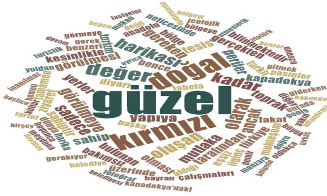
Şekil 3. Narman Peri Bacaları Ziyaretçi Yorumları Kelime Bulutu

Şekil 3'te gösterilen kelime bulutu, ziyaretçilerin Narman Peri Bacaları ile ilgili deneyimlerini içeren yorumlarından NVIVO 12 programı kullanılarak oluşturulmuştur. Güzel, doğal, harika gibi bölge hakkında olumlu çağrışımlar yapan kelimeler ön plana çıkmıştır. Bunun yanı sıra kırmızı kelimesi de Narman Peri Bacalarının doğal oluşum rengi olarak kelime bulutunda ön sıralarda belirmiştir.