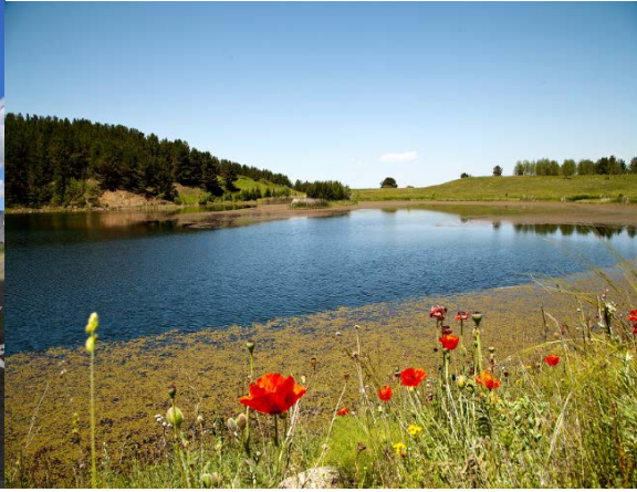
Narman Beş Goller