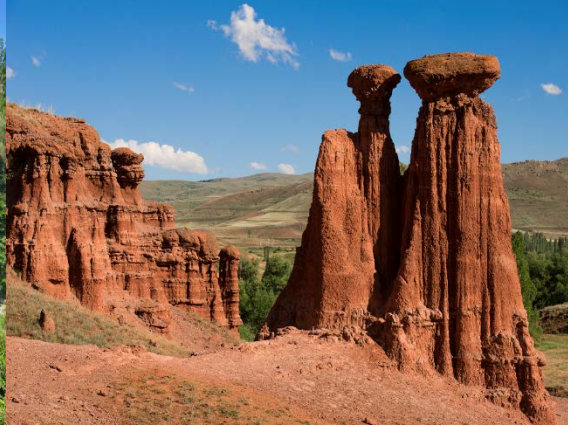
Narman Peri Bacaları