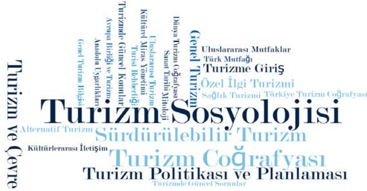
Şekil 5. Turizm Teması Alt Kod Bulutu

Şekil 4’te “genel yetenekler” temasına ait alt kod bulutu yer almaktadır. Minimum sıklığın 5 olduğu temada en yoğunluklu derslerin “Türk Dili” ve “Atatürk İlkeleri ve İnkılap Tarihi” olduğu görülmektedir. Bunun yanında “Girişimcilik”, “Turizmde Etik”, “Gönüllülük Çalışmaları” ve “Kariyer Planlama” dersleri de yer almaktadır. “Genel yetenekler” teması altında çok sayıda (770) ders olmasına rağmen kod bulutunda az sayıda dersin yer almasının nedeni ders türünün çok fazla olmasından kaynaklanmaktadır.