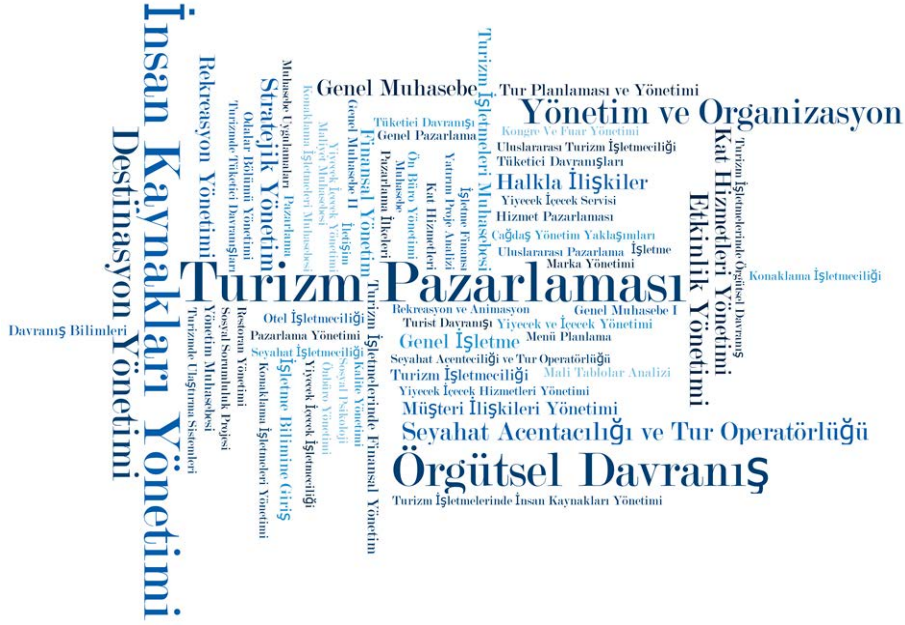
Şekil 2. Yönetim Teması Alt Kod Bulutu

En fazla ders sayısına sahip olan temalar “yönetim”, “dil”, “genel yetenekler” ve “turizm” dir. İçerik analizi kapsamında bu temaların kod bulutu gösterimleri aşağıda yer almaktadır. Kod bulutu analizi ana tema için kodlaması yapılan kelimelerin veri belgelerinde geçme sıklıklarına bağlı olarak şekillenmekte ve en büyük puntolu kelime en büyük sıklığa sahip kelime olarak değerlendirilmektedir (Aldemir vd., 2020: 978). Bu çalışma kapsamında kullanılan kelimelerin sınırlandırılması için frekans olarak “5” değeri en alt değer olarak belirlenmiş ve “5” ve üzerinde frekans değerine sahip olan kelimeler kelime bulutuna dâhil edilmiştir.