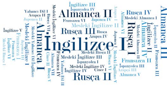
Şekil 3. Dil Teması Alt Kod Bulutu

Şekil 2’de “yönetim” temasına ait alt kod bulutu yer almaktadır. Kod bulutunda sıklık düzeyi minimum 5 olan derslerin isimleri yer almaktadır. Şekil incelendiğinde “İnsan Kaynakları Yönetimi”, “Örgütsel Davranış”, “Turizm Pazarlaması” derslerinin müfredatlarda en fazla yer alan ders olduğu görülmektedir.