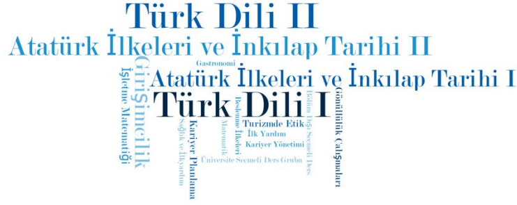
Şekil 4. Genel Yetenekler Teması Alt Kod Bulutu

Şekil 4’te “genel yetenekler” temasına ait alt kod bulutu yer almaktadır. Minimum sıklığın 5 olduğu temada en yoğunluklu derslerin “Türk Dili” ve “Atatürk İlkeleri ve İnkılap Tarihi” olduğu görülmektedir. Bunun yanında “Girişimcilik”, “Turizmde Etik”, “Gönüllülük Çalışmaları” ve “Kariyer Planlama” dersleri de yer almaktadır. “Genel yetenekler” teması altında çok sayıda (770) ders olmasına rağmen kod bulutunda az sayıda dersin yer almasının nedeni ders türünün çok fazla olmasından kaynaklanmaktadır.