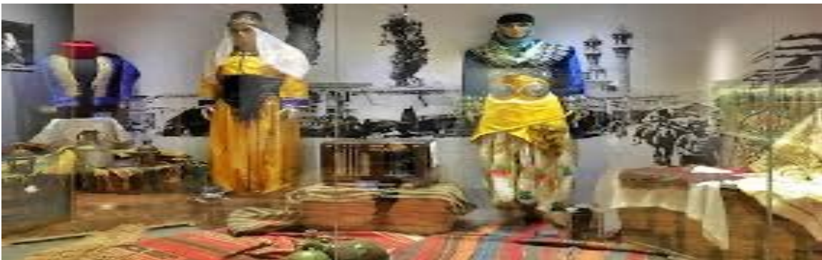
Resim 6: Sille Müzesi Konya

Resim 5’de Gülsüm Güral Müze’sinde Kütahya ili geleneksel ev yaşantısını yansıtan bir mekan içerisinde halı, yaygı, örtü ve geleneksel kıyafetler giyinmiş kadınlar sergilenmektedir. Tür bakımından sürekli sergiler kısmında, otantik biçimde, anı ve hatıra sergisi olarak sınıflandırılabilir.