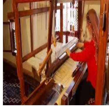
Resim 4: Mardin Yaşayan Müze

Resim 3’de Mardin Yaşayan Müze’de Mardin geleneklerine ilişkin oluşturulmuş bir salon ve yer halısı örneği ile dokuma kumaştan minderler ve Mardin geleneksel kıyafetlerin giyinmiş kadınlar görülmektedir. Resim 4’de ise Mardin halısı dokuyan kadın örneğine rastlanmaktadır. Bulgularda yer alan, sürekli- otantik ve anı hatıra sergisi olarak değerlendirilmektedir.