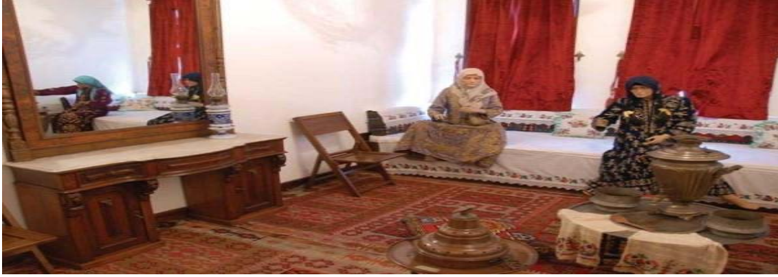
Resim 7: Amasya Hazeranlar Müzesi

Resim 6'da Sille Müzesinde, Konya iline özgü geleneksel tekstile ilişkin örnekler rastlanmaktadır. Tür bakımından sürekli sergiler kısmında, otantik biçimde, anı ve hatıra sergisi olarak sınıflandırılabilir.