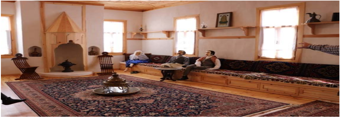
Resim 2: Beypazarı Yaşayan Müze

Resim 1 incelendiğinde Mustafa Kemal Atatürk'e ait Ankara Etnografya Müzesinde sürekli olarak sergilendiği ve anı hatıra sergileri kısmına girdiği ifade edilebilir.