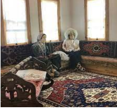
Resim 3: Mardin Yaşayan Müze