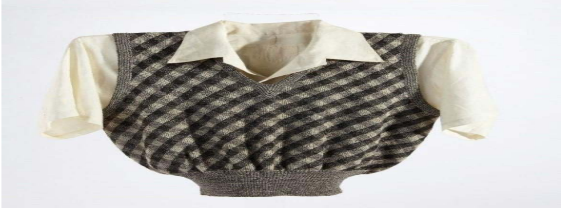
Resim 1: Ankara Etnografya Müzesi

Bazı müzelerde sergilenen tekstiller ile ilgili örnekler aşağıdaki gibidir.