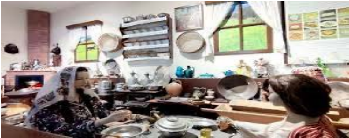
Resim 5: Gülsüm Güral Müzesi Kütahya

Resim 3’de Mardin Yaşayan Müze’de Mardin geleneklerine ilişkin oluşturulmuş bir salon ve yer halısı örneği ile dokuma kumaştan minderler ve Mardin geleneksel kıyafetlerin giyinmiş kadınlar görülmektedir. Resim 4’de ise Mardin halısı dokuyan kadın örneğine rastlanmaktadır. Bulgularda yer alan, sürekli- otantik ve anı hatıra sergisi olarak değerlendirilmektedir.